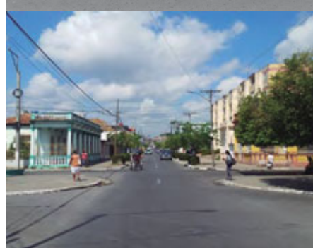
Calle Maceo, año 2018