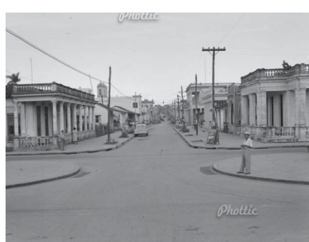
Calle Maceo, año 1950